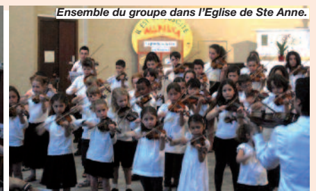
Ensemble du groupe dans l'Eglise de Ste Anne.