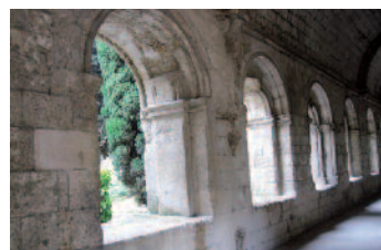
Le cloître de l’Abbaye de Silvacane. C’est toujours beau un cloître.

Construit en plein cœur de celui-ci, ce musée propose deux espaces : Géosciences-Provence qui, grâce à des fossiles, maquettes, moulages et représentations graphiques, raconte 300 millions d’années d’aventures géologiques en Provence. L’autre espace appelé “Kuna” plonge au cœur de la couleur, dans l’univers d’une civilisation surprenante : les Kuna du Darien (Colombie et Panama). Après cette véritable exploration magnifiée par