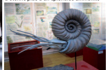
Le Musée de La Roque d’Antheron qui en a étonné plus d’un splendide ammonite