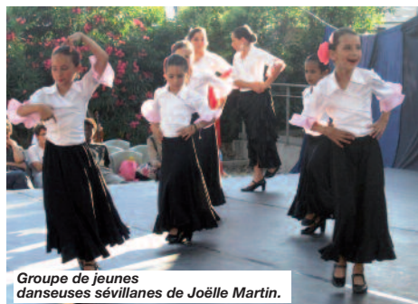
Groupe de jeunes danseuses sévillanes de Joëlle Martin.