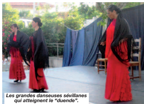
Les grandes danseuses sévillanes qui atteignent le "duende".