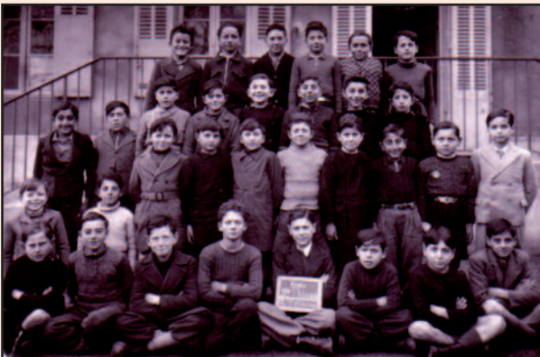
Photo ancienne de classes

Il s'agit de l'Ecole Primaire Communale de la Rue Thieux, mais nous ne disposons pas de beaucoup de précisions : parfois il nous manque même l'année, quant aux noms, ils ne figurent pas dans nos albums. Aussi nous demandons à tous ceux qui sont de cette époque un effort de mémoire pour nous communiquer toutes les informations utiles relatives à cette classe dont nous publions la photos. Il y en aura d'autres par la suite.