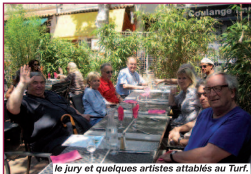
le jury et quelques artistes attablés au Turf.