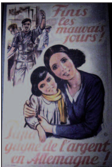
Autre affiche : la propagande de l'époque. Avec le recul ça fait réfléchir.

Qu’aurait-il dit ce samedi 18 mai, s’il s’était trouvé avec les 57 participants à cette nouvelle journée de découverte de notre région? C’est en effet sous des trombes d’eau que nous nous