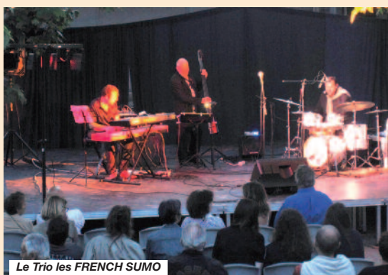
Le Trio les FRENCH SUMO

Le lendemain de la fête annuelle des AIL c'était la fête de la musique. Le Club Chantant a ouvert la soirée dans le même style que la veille avec des chansons provençales mettant en valeur