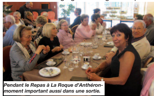
Pendant le Repas à La Roque d’Antheron - moment important aussi dans une sortie.

Après cet intermède gastronomique, nous entreprenons la visite de l’ Abbaye de Silvacane , l’une des trois sœurs cisterciennes avec Sénanque et le Thoronet . A la suite d’un guide, nous découvrons ce magnifique bâtiment qui raconte l’histoire de notre région à travers celle des congrégations religieuses qui se sont succédées en