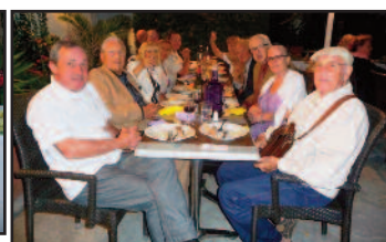
Et toujours une tablée, prise au hasard mais avec d'éminents représentants de notre CIQ.

humeur et de refrains qui ont marqué l'histoire de notre chanson française, dont on n'épuisera pas de sitôt l'héritage. Félicitations à ce Trio de grand talent.