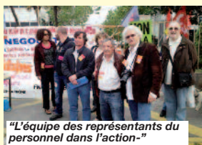
"L'équipe des représentants du personnel dans l'action"