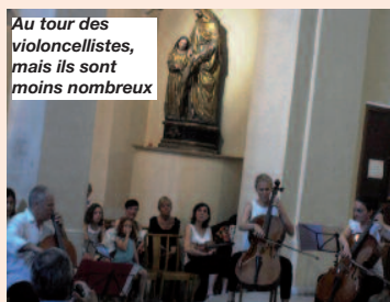
Au tour des violoncellistes, mais ils sont moins nombreux