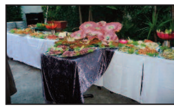
Le buffet de la Brasserie de l'Aillaude bien garni et en 2 parties pour éviter les bousculades : bonne idée !